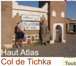
Haut Atlas Col de Tichka