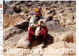
Bergère du Saghro