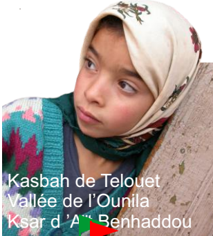
Kasbah de Telouët Vallée de l'Ounila Ksar d'Ait Benhaddou

3 jours, 2 nuits avec saidmountainbike.com