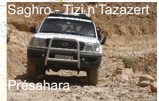
Saghro - Tizi n'Tazazert Présahara