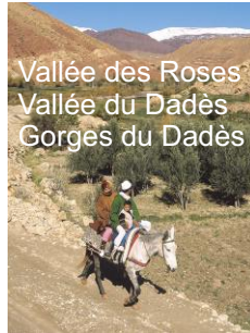
Vallée des Roses Vallée du Dadès Gorges du Dadès