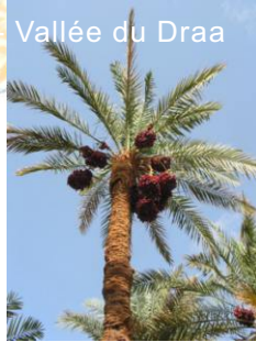
Vallée du Draa