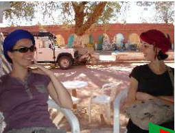
Vallée de l'Ounila Kasbah de Telouet

4 jours, 3 nuits avec saidmountainbike.com