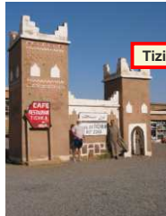
Marrakech Haut Atlas