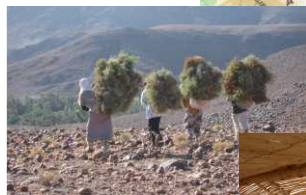
Vallée du Drâa Palmeraies