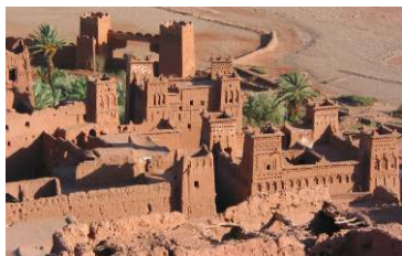
Vallée des Roses et des mille kasbahs Vallée et gorges du Dadès - Vallée du Todra