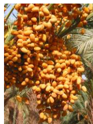
Vallée du Drâa Palmeraies