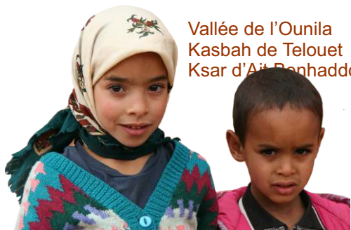
Vallée de l'Ounila Kasbah de Telouet Ksar d'Aït Benhaddou

5 jours, 4 nuits avec www.saidmountainbike.com