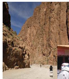
Gorges du Todra Palmeraie de Tinerhir