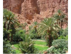
Vallée des roses et des kasbahs Vallée et gorges du Dades