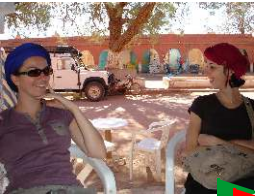
Vallée de l'Ounila Kasbah de Telouet

4 jours, 3 nuits avec www.saidmountainbike.com