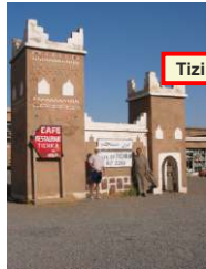
Marrakech Haut Atlas