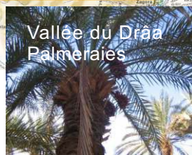
Vallée du Drâa Palmeraies