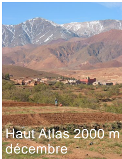
Haut Atlas 2000 m décembre