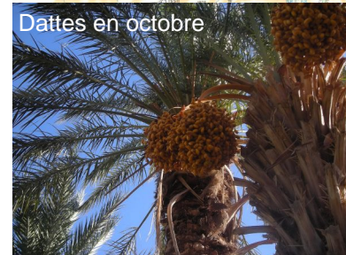
Dattes en octobre