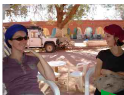
Vallée de l'Ounila Kasbah de Telouet

4 jours, 3 nuits avec www.saidmountainbike.com