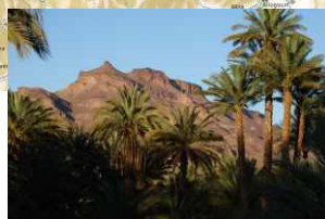
Vallée du Drâa Palmeraies