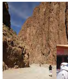
Gorges du Todra Palmeraie de Tinerhir