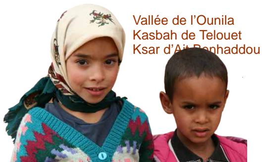
Vallée de l'Ounila Kasbah de Telouet Ksar d'Aït Benhaddou

5 jours, 4 nuits avec saidmountainbike.com