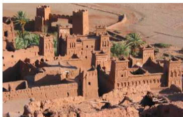
Vallée des Roses et des mille kasbahs Vallée et gorges du Dadès et du Todra